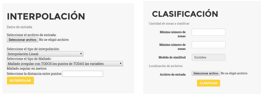
Fig. 2. Capturas de pantallas de configuración del análisis.

En la Figura 2 se ven ejemplos de pantallas del sistema web, mediante las cuales el usuario ingresa los datos de campo e imágenes, así también como los parámetros que necesita el método para la zonificación (valores por defecto son sugeridos al usuario).